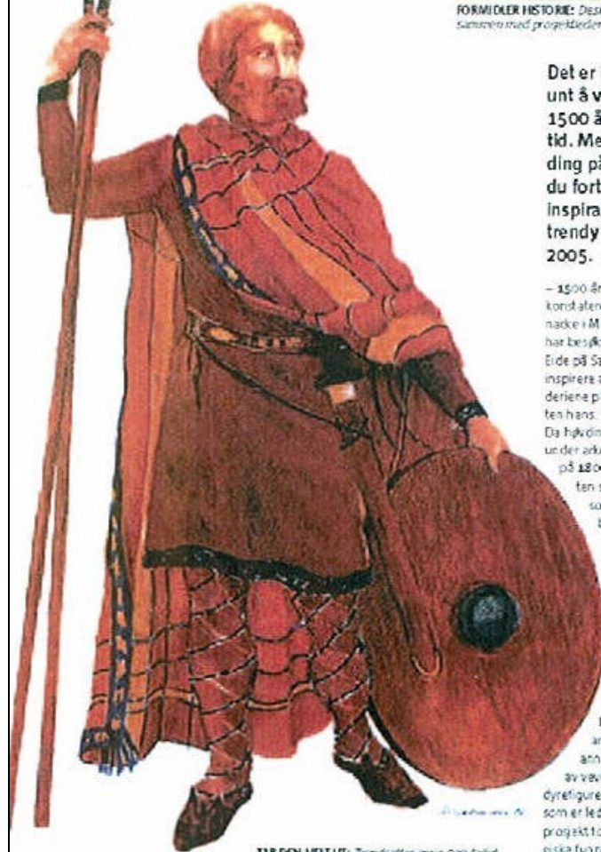
TAR DEN HEILT UT: Trendsetter anno 2005, Moods of Norway tar retromoten heilt ut og gjer Eidehovdingen til den viktigste inspirasjonskilden for sin neste kolleksjon.