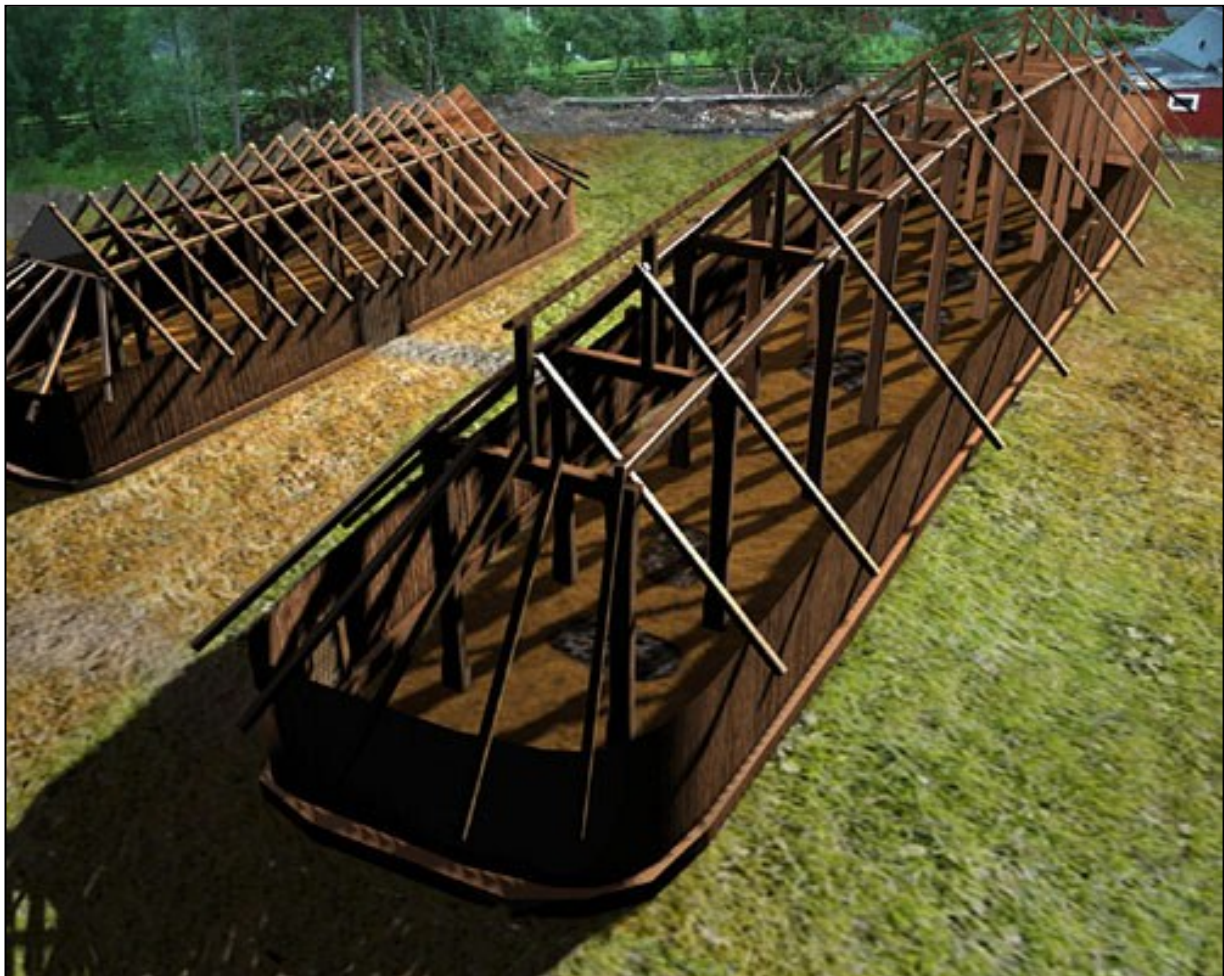
Rekonstruksjon av Eidegarden. Skisse laga av Arkikon.