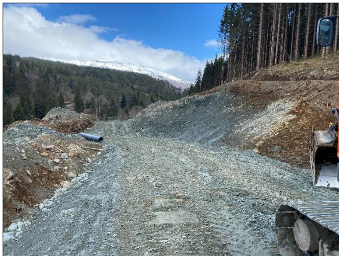
Bygging av ny skogsveg.