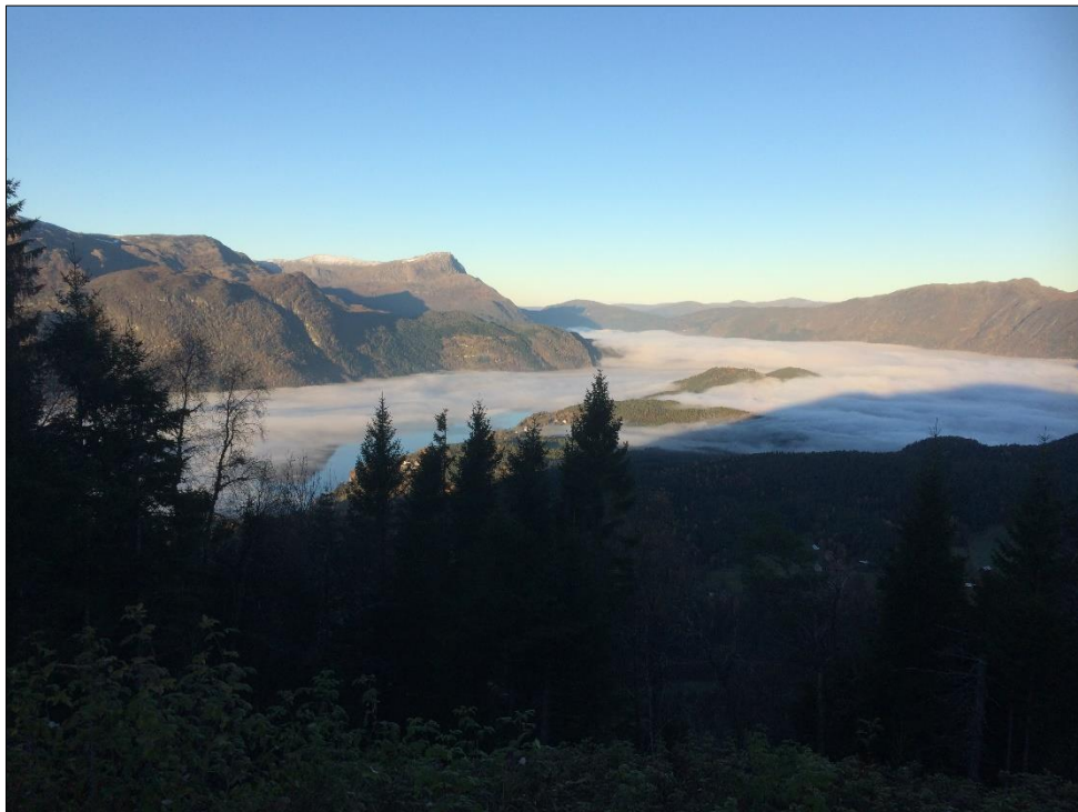
Utsyn mot Hyeneshesten.