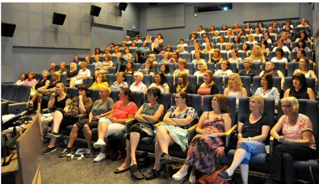
Barnehagetilsette på kurs

Gloppen kommune skal vere ein moderne og attraktiv arbeidsgjevar som klarar å rekruttere, utvikle og behalde kompetente medarbeidarar som går på jobb kvar dag for å yte gode tenester for innbyggjarane.