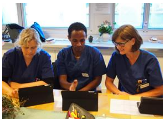
Tilsette i Sandane heimteneste