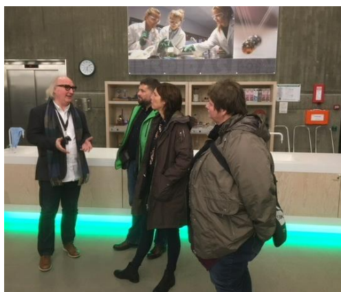
Leiarar og ordførar på studietur